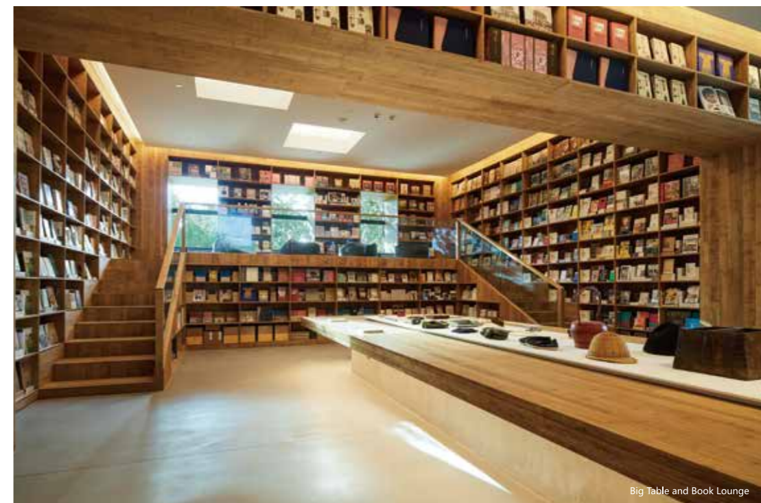
Big Table and Book Lounge

当旅程和移动成为当代生活的一部分，人们对其需求也逐渐“生活方式化”——在传统的“消费”行为之外，“体验”的创造日益重要。MUJI HOTEL从这一需求出发，以酒店为基础，呈现MUJI HOTEL设施、服务与无印良品精神、产品融合的城市空间：从细致入微的无印良品日用品到别具品牌品味的客房设置，从Café&Meal MUJI、MUJI Diner的定制餐品到与无印良品一脉相承的特色设计，从舒适的睡眠到兼容城市风情的服务；带给你舒适体验的这些细节点滴，都将成为旅行者一段美好旅途的起点，也是整理身心再次出发的动力。集中呈现特色服务与品质、同时摒弃奢靡冗杂的服务，这也正是MUJI HOTEL“反豪华，反简陋”的理念所在。