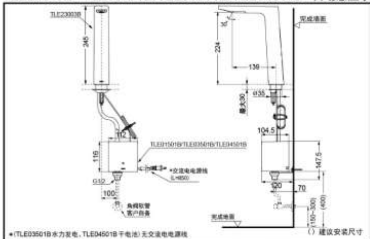
TLE23003B+TLE01501B/TLE03501B/TLE04501B 自动感应水嘴+控制器部(单冷)